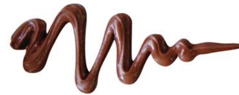
이로코 / C1000068