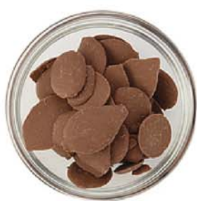
PL-100 / C1000059