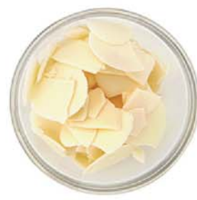
DOWER / C1000057