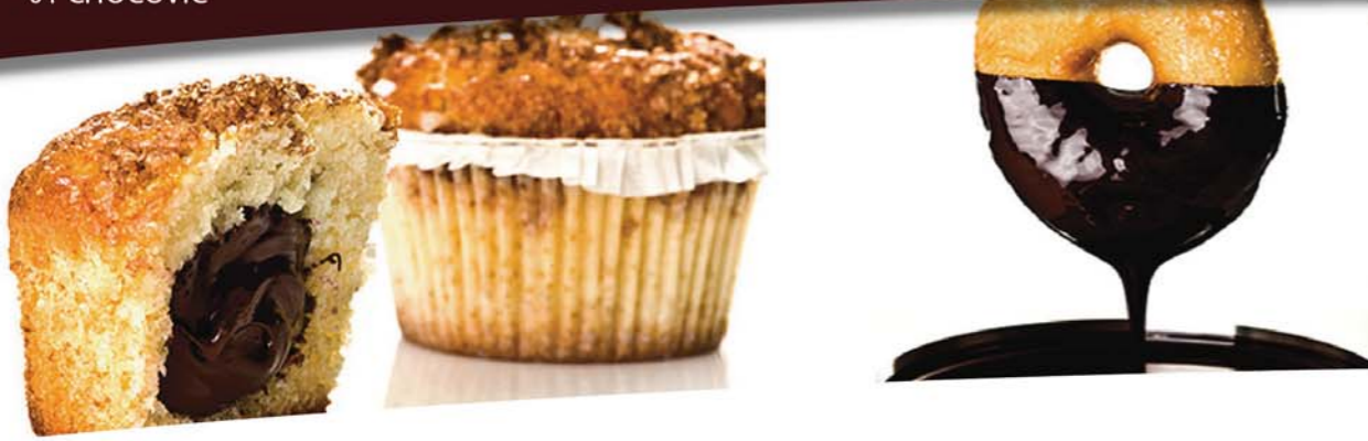
coating with premium chocolate flavour