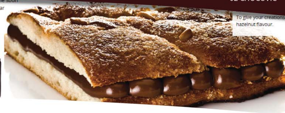
To give your creations a hazelnut flavour.

"초코빅은 프리미엄 초콜릿재료로 세계에서 인정받는 125년 전통의 초콜릿 브랜드입니다."