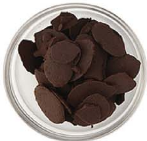
P-250 / C1000056