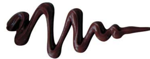
아자바체 / C1000228