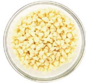
안디나 / C1000067