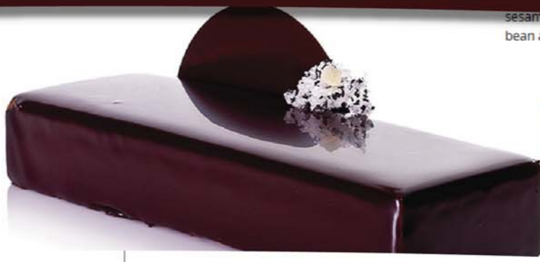
sesame soon bean ar