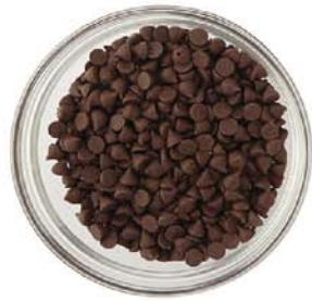
코리 750 / C1000061